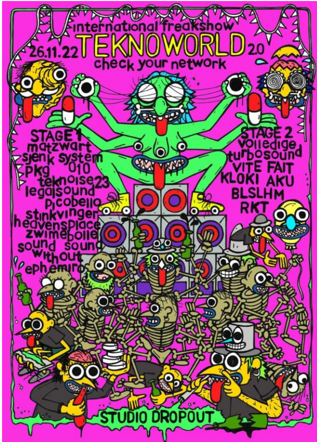
Studio Dropout, Flyer free party in Ammerzoden (Ammerzoden: 26 november 2022).

Ammerzoden op 26 november 2022, waarvoor Nederlandse, Duitse, Belgische en Franse collectieven samenwerkten en duizenden feestvierders naar de leegstaande loods lokten. 166